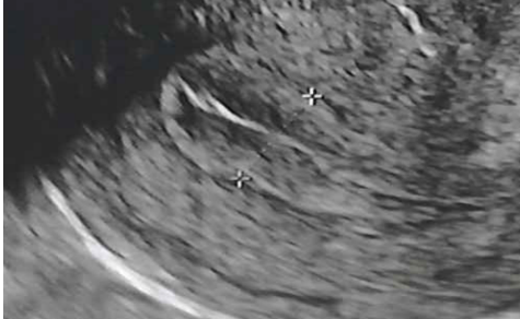
Endometriet måles i midtlinjesnitt

Ultralydundersøkelse for responsvurdering av hormonstimulering. På vegne av Seksjon for assistert befruktning, Haukeland universitetssjukehus.