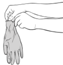
Hold hansken øverst i mansjetten. Berør minst mulig av hanskens utside.