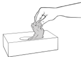
Ta en hanske ut av hanskeboksen. Unngå å berøre de andre hanskene i boksen.