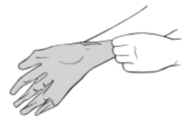
Ta hansken på første hånd.