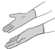
Når hanskene er tatt på, unngå unøwendig berøring av gjenstander før oppgaven utføres.