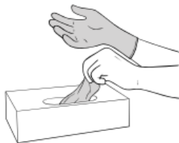
Ta en ny hanske ut av esken. Unngå å berøre de andre hanskene i boksen og berør minst mulig av hanskens ytterside med bar hud.