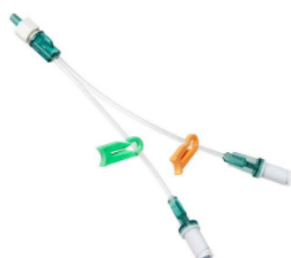
Octopus 2-lumen 10 cm slange, 2 løp Ref.: 841.264