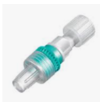
BBraun Infuvalve Medikamentresistent tilbakeslagsventil (anti-retur) - tillater passiv flow Avtale: 201915. Ref.: 4095000C

Mottrykksventil hindrer tendens til luftbobler, og brukes på infusjon av fettløsninger, amiodarone og noen typer cytostatika. Benyttes kun på infusjonspumper/EDA/PCA-pumper, og aldri på sprøytepumper (mottrykket vil bli for stort for sistnevnte).