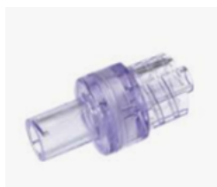
Alaris Anti-siphonventil (mottrykksventil) - krever positivt trykk for væske flow Avtale: 403061