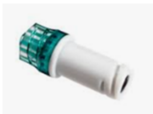
Vygon Bionector Avtale: 201920. Ref.: 896.03

Nålefri kobling, med og uten forlengesslange (opptil 3 lumen, se nedenfor). Lekkasjefri tilgang til kateteret via koblingen. Koblingen har en ventil som hindrer tilbakestrømming av blod og væske.