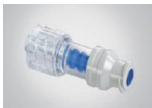
BD Smartsite Avtale: 403061. Ref.: 2000E7D

Disse ventilene tillater både injeksjon og tilbaketrekking av væske, og flow blir stoppet i begge retninger når de kobles av. Dette reduserer risiko for luftemboli ved til- og frakobling av infusjonslinjer.