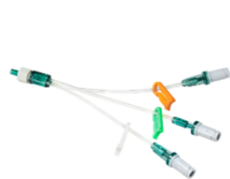
Octopus 3-lumen 10 cm slange, 3 løp Avtale: 201920. Ref.: 841.364