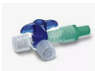
Treveiskran Discofix C = stoppventil Avtale: 201920. Ref.: 16494C/ 16700C/ 16760C

Sprekkresistent mot lipider/medikamenter med høy pH-verdi. Roterende adapter for enkel tilgang, og klikkfunksjon for justering. Leveres uten eller med slange (10cm og 100cm). Kan oppleves noe stivere enn tidligere siden den nå er PVC-fri.