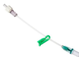
Octopus 1-lumen 10 cm slange Ref.: 5222.014